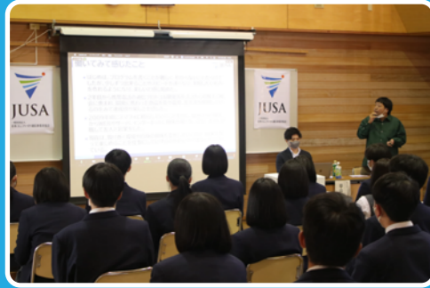
静岡県立松崎高校でのICT講座の様子