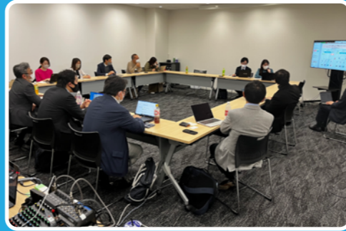
電気通信事業者向け勉強会の開催